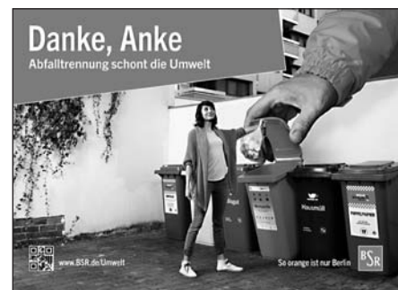
Werbung für Mülltrennung

Das Land Berlin beschafft Produkte und Dienstleistungen in einem finanziellen Umfang von rund 4 bis 5 Milliarden Euro pro Jahr. Das sind umweltfreundliche Produkte und Materialien sowie umweltschonende Verfahren bei der Erfüllung von Leistungen.