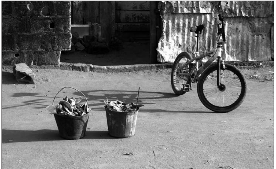
In Kamerun wird der Müll z. B. in Eimern auf der Straße zum Abholen postiert

Die Wahrheit liegt also wie immer irgendwo dazwischen: es gibt durchaus