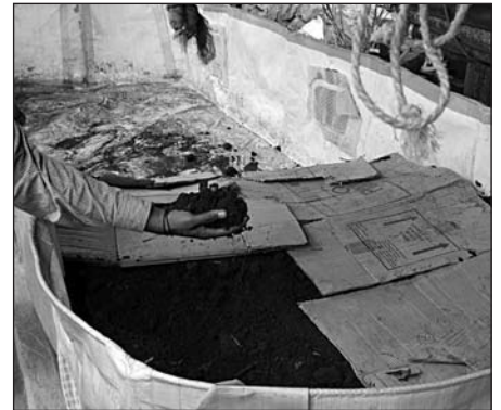
Feinster Kompost bei Anishas Bauern

Die Projektregion von Anisha hatte auch das gleiche Problem wie die anderen ländlichen Gebiete von Indien. Hier leben viele Bauernfamilien. Sie entsorgten alle Haushaltsabfälle in Kompost-Gruben, auch Flaschen, Kunststoffe, Shampoo-Behälter, Pinsel usw., ohne diese Materialien zu trennen. So enthielten die meisten der Kompostmieten Kunststoffe und andere unerwünschte Materialien, und sie gelangten somit auch auf die Farmen. In der Anfangsphase des Anisha-Projekts konnten wir auf dem Farmland viele Kunststoffabdeckungen sehen. Wir hatten eine harte Zeit, um die Bauern aufzuklären über die Bedeutung von Kompost, welche Dinge in die Kompost-Grube gegeben werden können, wie der Kompost weiter behandelt werden muss usw.. Jetzt sind die Bauernfamilien informiert, sie trennen den Müll von Haus und Küche, und in die Kompost-Grube gelangen nur noch die kompostierbaren Materialien. Die Landwirte kontrollieren heute auch den Kompost, der zu ihren Höfen an-