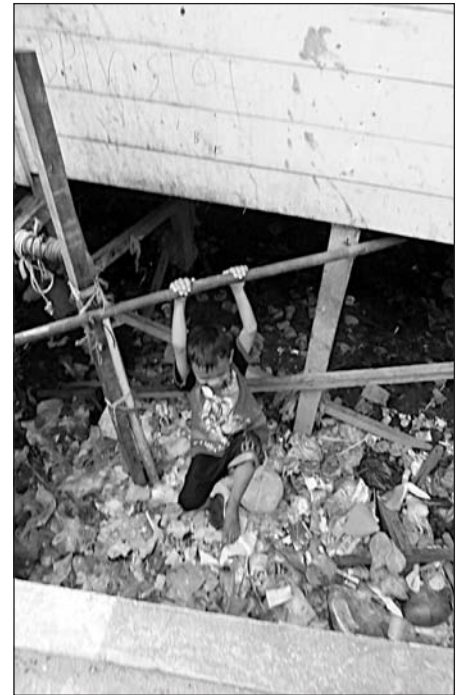
Müllentsorgung bei den Flüssen

Offenbar gibt es Anreize in den Dörfern, denn die Menschen dort verkaufen Dosen, Glas und Papier. Ich nehme an, das Gleiche passiert in Palangkaraya und Jakarta. Es gelingt jedoch nicht mit Kunststoff und ähn-