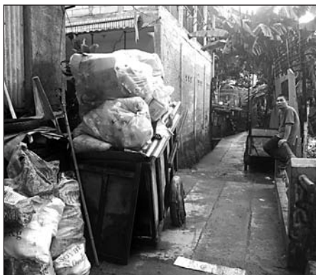
Hauptproblem in Indonesien ist der Plastikmüll

Erst einmal möchte ich betonen, dass Rungan Sari ein sehr spezieller Platz ist, mit einer ziemlich einzigartigen Zusammensetzung von verschiedenen Menschen. Es kursieren Vermutungen, dass Rungan Sari von Millionären bewohnt wird, die ein entspanntes Leben in einer Idylle führen. In der Realität handelt es sich um sehr fleißige, oft mit finanziellen Herausforderungen kämpfende Menschen. Sie sind sich der weltweiten Abfallproblematik bewusst. Meist kennen sie den Vorteil einer gut gelösten Abfallwirtschaft aus ihren Herkunftsländern, und angesichts der Tatsache, dass sie dort effizient läuft, verbringen sie hier nicht viel Zeit, darüber nachzudenken.