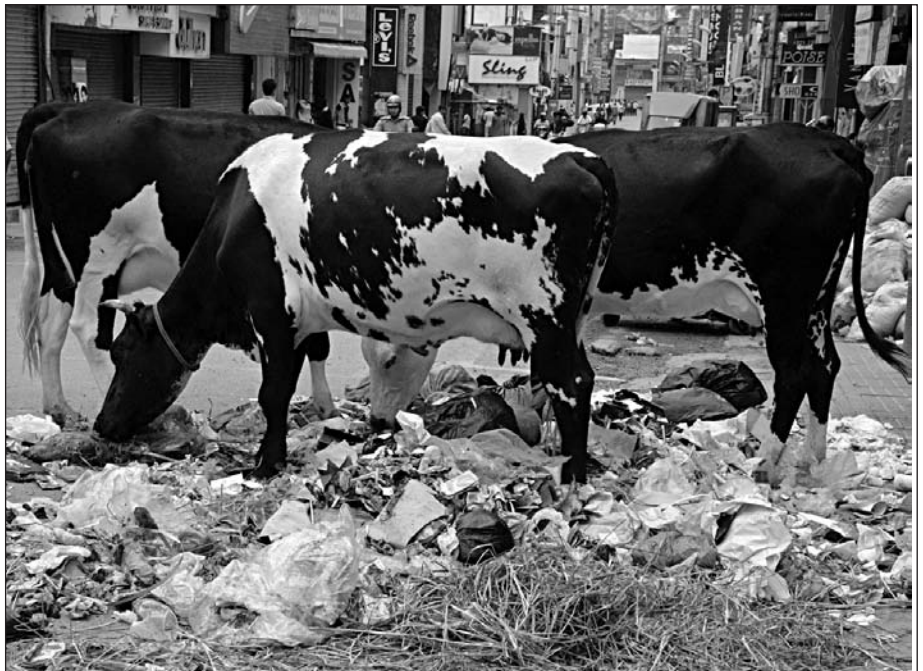
Kühe sind in Indien Abfallverwerter

In ländlichen Gebieten gibt es die schlechtesten Zustände, weil es hier auch der kommunalen Selbstverwaltung nicht gelingt, die Abfallentsorgung in den Griff zu bekommen. Die Menschen werfen den Müll in die Stra-