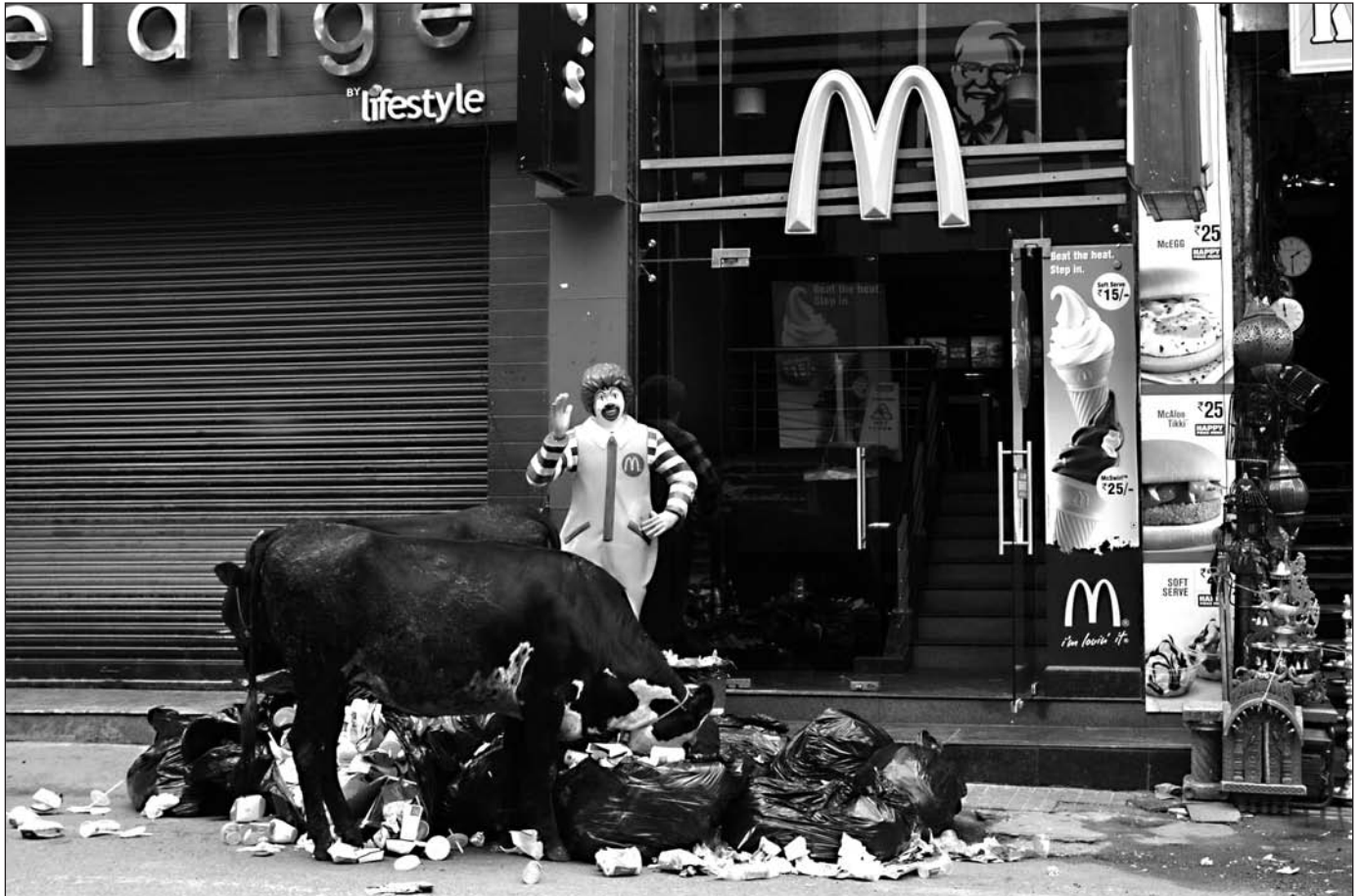
Kühe in Bangalore beim Suchen nach einer Mahlzeit Müll