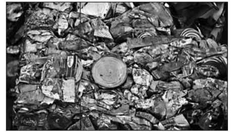
Ein Kubikmeter gepresster Müll

Schnell hat es sich gezeigt, dass die „Beseitigung“ - das Hinausschaffen der Abfälle aus dem Weg, aus der Stadt, auf Deponien, in die freie Landschaft oder die später eingesetzte Technik der