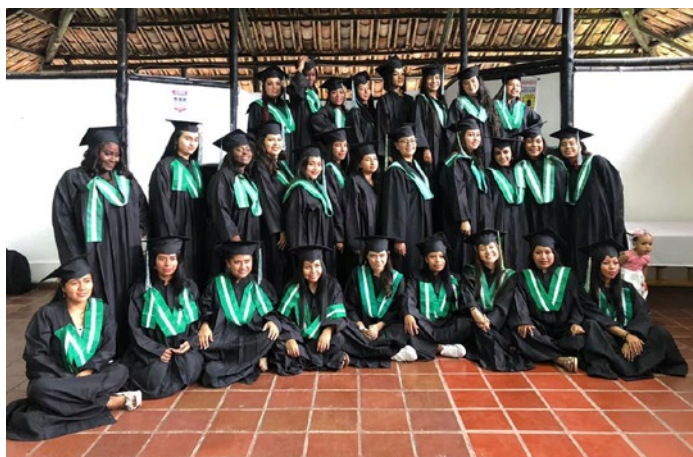
Abschlussfoto zur Übergabe der Zertifikate 2021 mit Robe und Hut