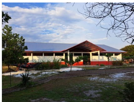
Kalimantan-Halle für Indoor-Sport, Kultur- und Freizeitveranstaltungen

Doch die Borneo Football International Academy bietet „mehr als Fußball“. Es werden auch Englisch-Unterricht und IT-Trainings angeboten. Die Philosophie ist, dass alle aufgrund ihres unterschiedlichen Hintergrunds voneinander lernen und profitieren können. Im Jahr 2023 erreichte das Projekt 2.460 Kinder mit Bildungsworkshops, Englisch-Grundkursen und Schulfußballaktivitäten. Darüber hinaus hat Borneo Football rund 320 Kinder aus lokalen Schulen mit Trikots, Ausrüstung und Trainerhilfe unterstützt,