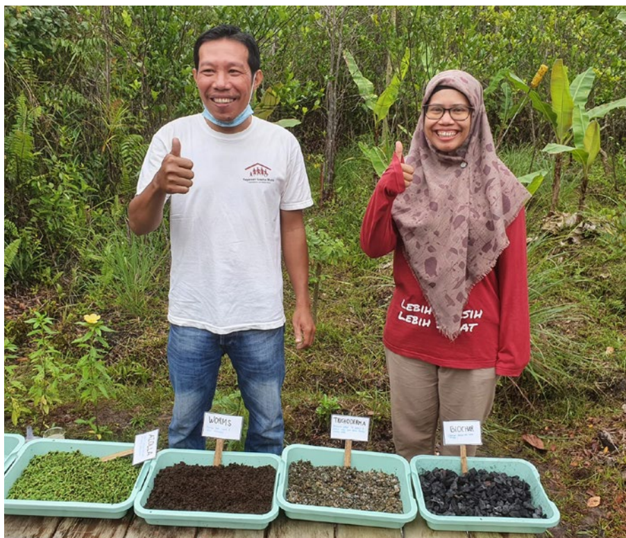
Trainer:innen für das AgroForestry-Projekt auf dem Forschungsgelände von YUM

baut. Die positiven Ergebnisse dieser Arbeit haben gegenseitigen Respekt, Vertrauen und ein Gefühl der Zuverlässigkeit zwischen den Gemeindemitgliedern und den Teammitgliedern der Nichtregierungsorganisation geschaffen. YUM wird auch nach Ende des BMZ-Projektes den Gemeinden unterstützend zur Seite stehen, um agroforstwirtschaftliche Methoden umsetzen und ausbauen zu können.