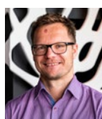
Projektbetreuung: Stefan Mühlbauer

Finanzierung: Das Agroforst-Projekt hat eine Laufzeit von zwölf Monaten mit einem Gesamtvolumen in Höhe von 129.535 Euro. Die BMZ-Förderung beträgt 75 Prozent. YUM und SD müssen demnach einen Eigenanteil von 32.384 Euro aufbringen. Jegliche Unterstützung ist willkommen.