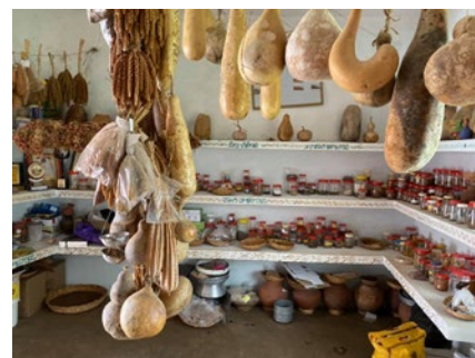
Saatgutbank des Anisha Rural Centers © Aminah Herrman

duzieren, Geld zu erwirtschaften bzw. einzusparen und die Fruchtbarkeit der Böden zu verbessern.