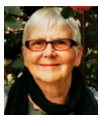
Projektbetreuung: Waltraut Biester

Für 2024 in Planung ist ein anamed-Heilpflanzen-Seminar in Douala, für das die Finanzierung noch aussteht – wir freuen uns über eure Unterstützung.