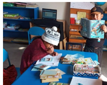
Insbesondere Unterrichtsmaterialien werden stets benötigt

Die Stiftung Yachay Kawsay ist eine nichtstaatliche, gemeinnützige Organisation, die ein nicht-direktives, nicht-schulbasiertes Selbstlernangebot offeriert. Es wird auf Kichwa und Englisch gelehrt und gelernt. Yachay Kawsay ist eine Gemeinschaft des Kichwa-Saraguro-Volkes im Süden Ecuadors in der Provinz Loja. Die Stiftung wurde 2019 gegründet, um das Ziel der Mitgliedsfamilien zu erreichen, eine regenerative Gemeinschaft nach andinen Prinzipien und Werten zu schaffen und zu leben.