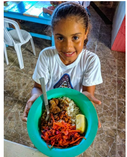
Bei den Himmelskindern gibt es für jeden eine warme Mahlzeit

„Himmelskinder“ richtet sich an Kinder und Jugendliche von der Straße und aus schwierigen Familiensituationen zwischen 6 bis 20 Jahren. Ein wichtiges Ziel ist, dass die Kinder regelmäßig zur Schule gehen und dadurch ihre Zukunftschancen verbessern. Vor allem aber zielt das Projekt auf einen Wandel in den Köpfen. Die Kinder sollen spüren, dass sie etwas wert sind und Chancen erhalten, ihre Identität und ihr Selbstbewusstsein zu entfalten. Die Entwicklung von Perspektiven, Träumen, aber auch gegenseitige Rücksichtnahme und Respekt sind wichtige Lernziele. Prävention und Zusammenarbeit mit den Familien verhindern, dass die Kinder auf der