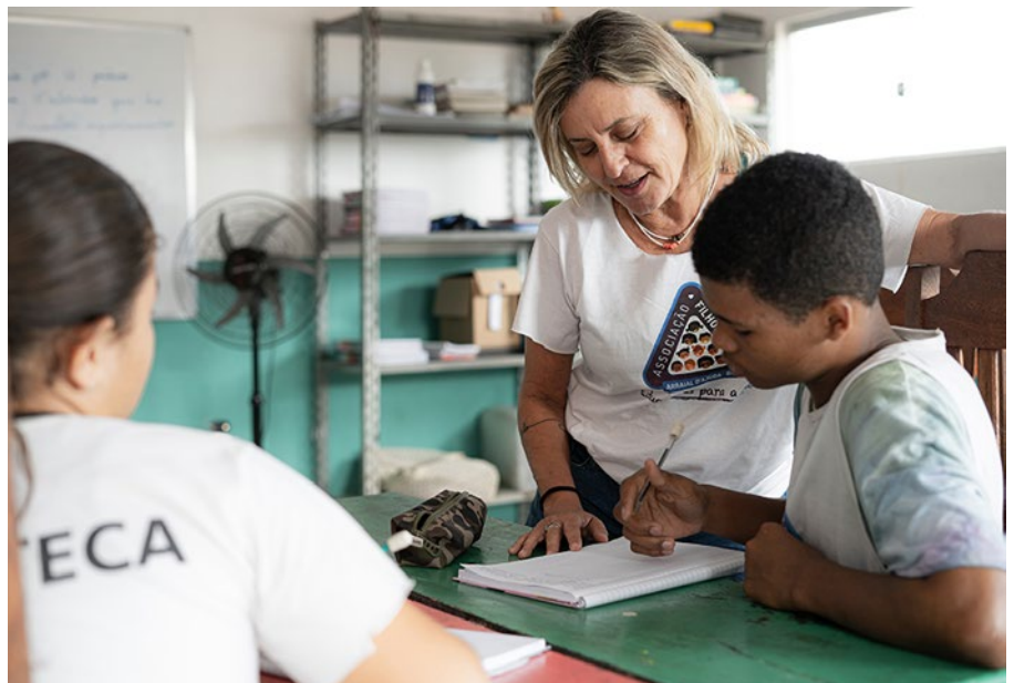
Unterstützung bei den Schulaufgaben im Kinderdorf Himmelskinder

Familie, Sexualität oder Gewalt werden mit den Kindern thematisiert, Werte definieren sich neu. Eine kleine Bibliothek ermöglicht Zugang zu Büchern, die sonst für die Familien unerschwinglich sind. Für die Gesundheit sorgt die enge Zusammenarbeit mit einem Zahnarzt