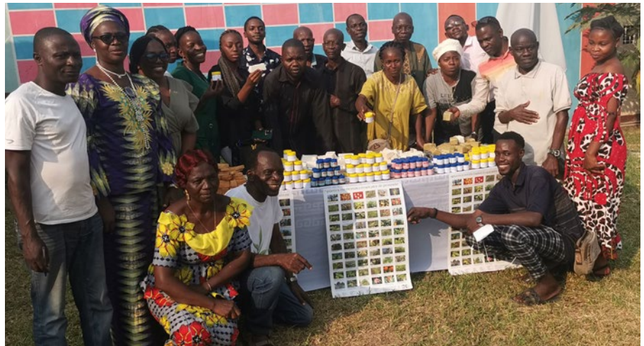
Abschluss des zweiten anamed-Seminars 2023 in der zweiten Ausbildungsreihe MEDNAT