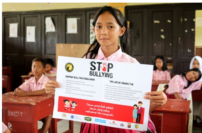
Mehr als Fußball – die Kinder lernen Teamarbeit und ein respektvolles Miteinander

Die Academy startete 2015 mit nur 14 Kindern. Die Nachricht, dass es Spaß macht hier mitzumachen, verbreitete sich schnell, und heute zählt die Akademie bereits 465 Fußball-Spieler:innen in fünf Trainingszentren. Es gibt vier reine Mädchenteams.