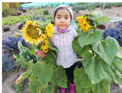
Ein Lernort für ALLE Kinder ist die Bildungseinrichtung in Otavalo

Der 1994 gegründete Kindergarten und die daraus entstandene Schule „Juan Enrique Pestalozzi“ sind die einzigen inkludierenden Bildungseinrichtungen in Otavalo. Sie haben das Ziel, eine nachhaltige Form des Lernens zu realisieren und damit ein sozial gerechtes Angebot für ALLE Jungen und Mädchen – und zwar mit oder ohne Behinderung – sowie deren Familien anzubieten.