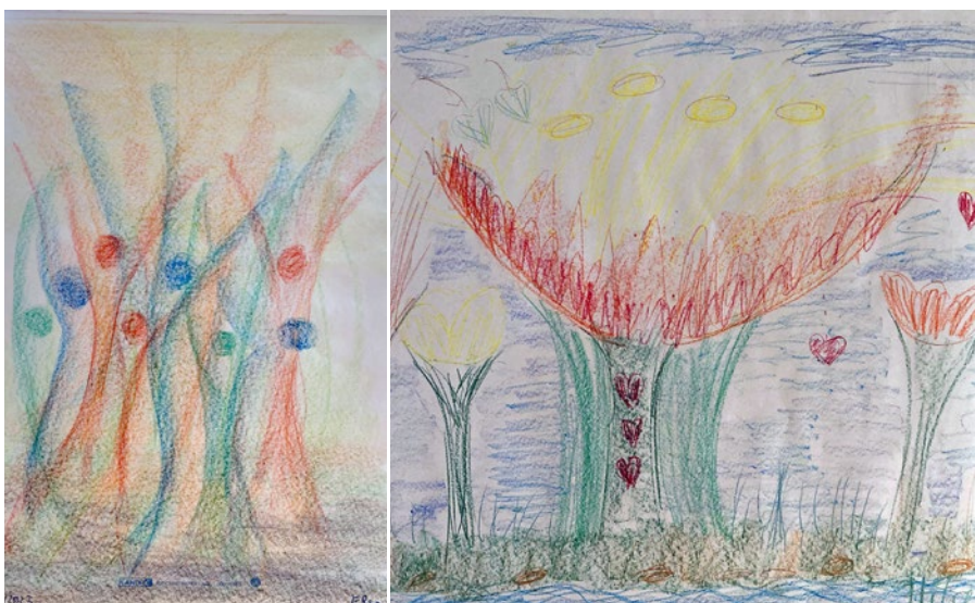
Die Gemeinsamkeiten unserer Bilder waren: Helles Licht, Strahlen, das Wachstum befördert auf festem Grund. Zuversicht und Stärke, Integration von Unterschieden, Fülle und Vielfalt sind erkennbar.

SD unterstützt das gegenseitige Lernen und bildet Synergien. SD ist im Austausch mit anderen SD Nationals, Subud Wings sowie anderen Nichtregierungsorganisationen (z.B. durch unsere