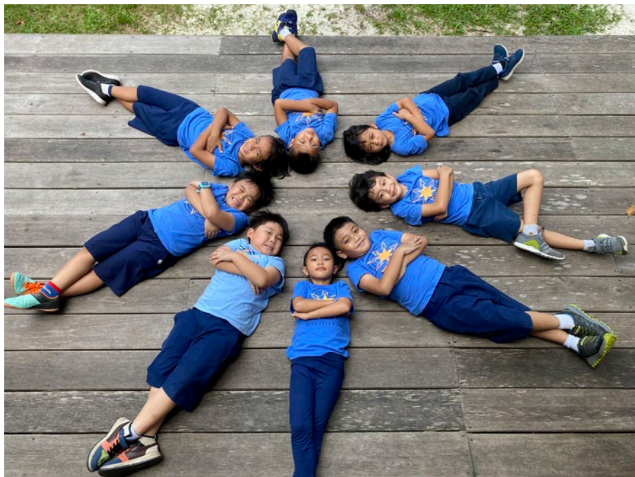
SD unterstützt bei der BCU-Schule insbesondere das Stipendienprogramm für Schüler:innen aus Familien mit niedrigem Einkommen

Die Schule wurde 2003 als Elterninitiative mit zehn Schüler:innen gegründet. Im Juli 2005 wurde sie als erste Nationale Plus-Schule in Zentral-Kali-