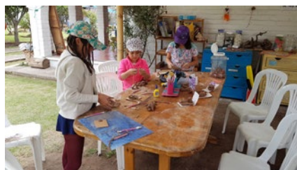
Alle drei Bildungsprojekte arbeiten mit Montessori-Lernmaterialien

Jahren, in dem ihre soziale, emotionale, motorische und kognitive Entwicklung unterstützt wird. In der Ludoteca-Umgebung interagieren die Kinder frei mit verschiedenen didaktischen Materialien, von denen die meisten Montessori-inspiriert sind. Es gibt eine Vielzahl von Innen- und Außenbereichen mit einer sog. vorbereiteten Umgebung für freies Spiel: im Freien, Gärtnern, Handwerkliches, Schreinerei, Experimente, Kochen, Musik, Tischspiele und Puzzles, Rollenspiele (Ankleiden, Laden, Puppenhaus), u.a.